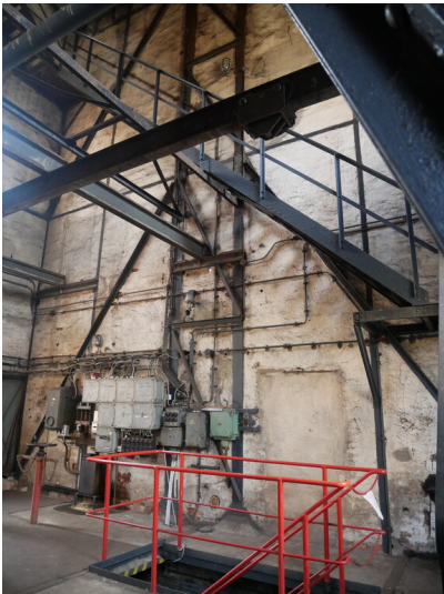
Kohlebunker der Brikettfabrik Louise