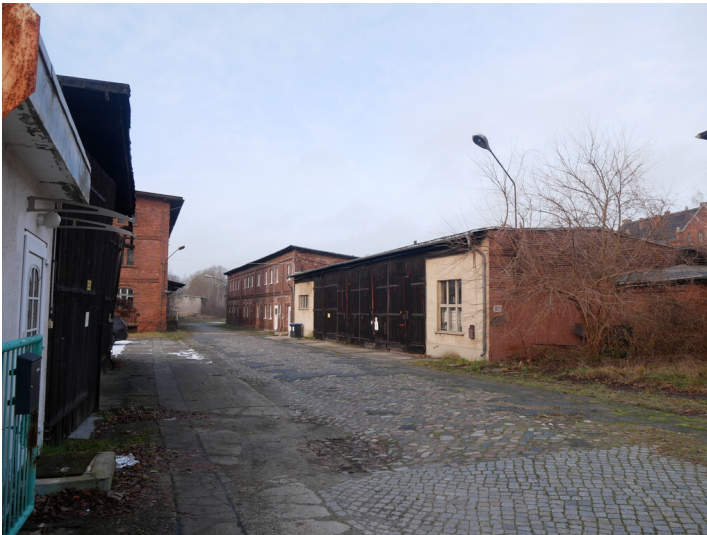
Betriebsbahnhof Stadtbahn Forst, Lokschuppen und Werkstattgebäude