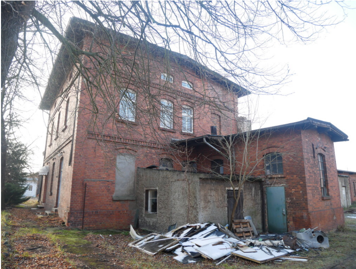
Betriebshof Stadtbahn Forst, Heizhaus