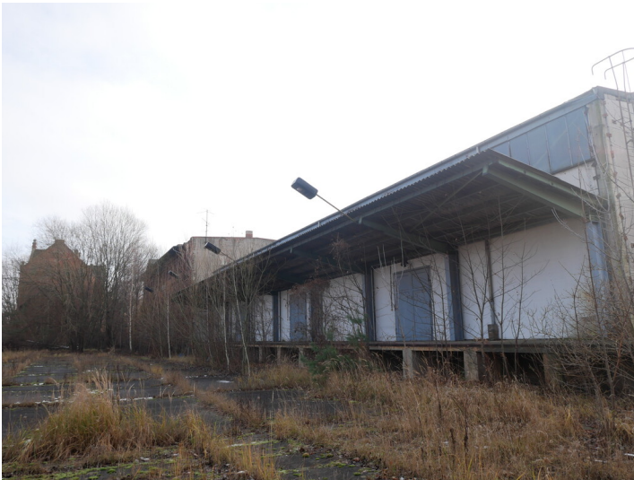
Betriebsbahnhof Stadtbahn Forst, Lagerhaus

Schlagwörter: Lagergebäude Fachsicht(en): Denkmalpflege Gemeinde(n): Forst (Lausitz) Kreis(e): Spree-Neiße Bundesland: Brandenburg