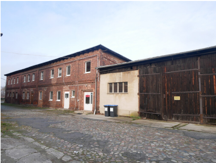
Betriebsbahnhof Stadtbahn Forst, Pferdestall