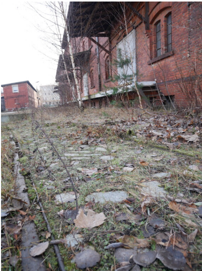
Betriebsbahnhof Stadtbahn Forst, Lagerhaus