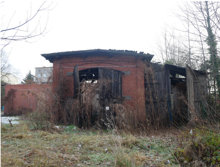
Betriebsbahnhof Stadtbahn Forst, Lokschuppen