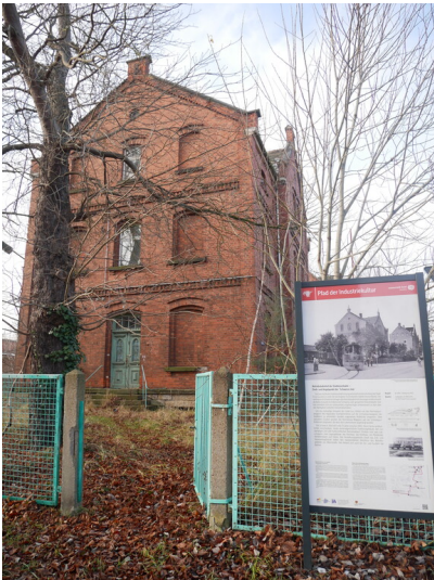
Betriebsbahnhof Stadtbahn Forst, Verwaltungsgebäude