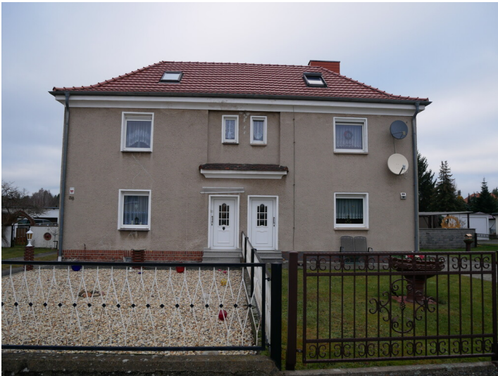
Doppelwohnhaus für Bergarbeiter