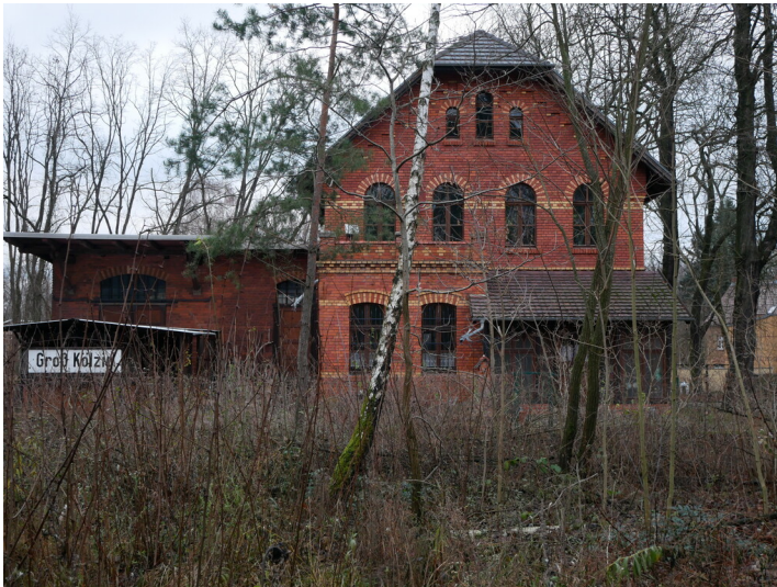
Bahnhof Groß Közlig