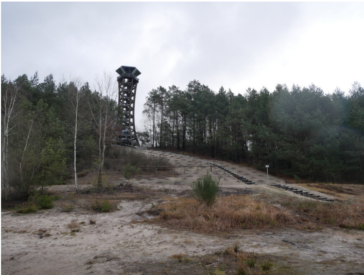
Aussichtsturm Felixsee