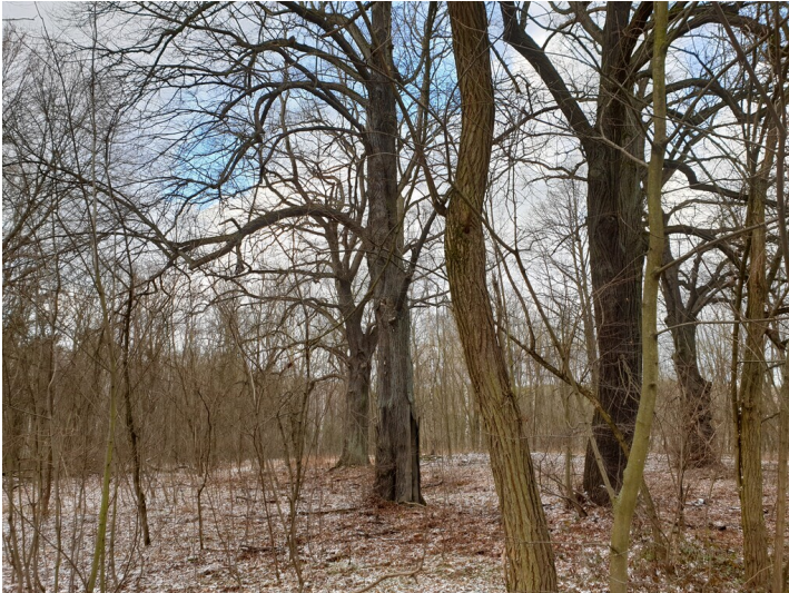
sog. Alte Grube, Ursprung der Grube Conrad