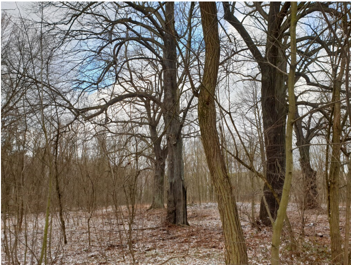
sog. Alte Grube, Ursprung der Grube Conrad