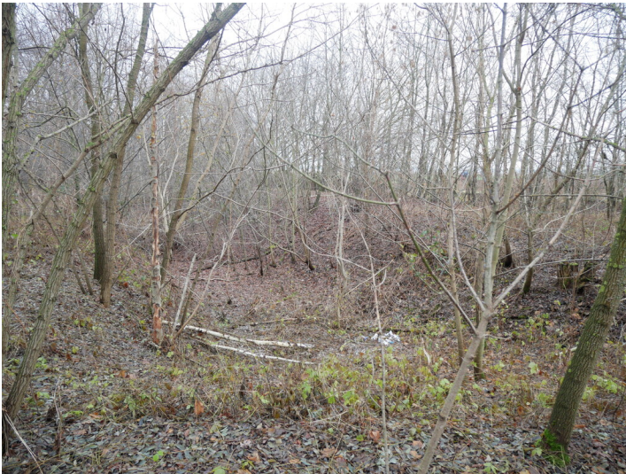
Altlauf Hammergraben