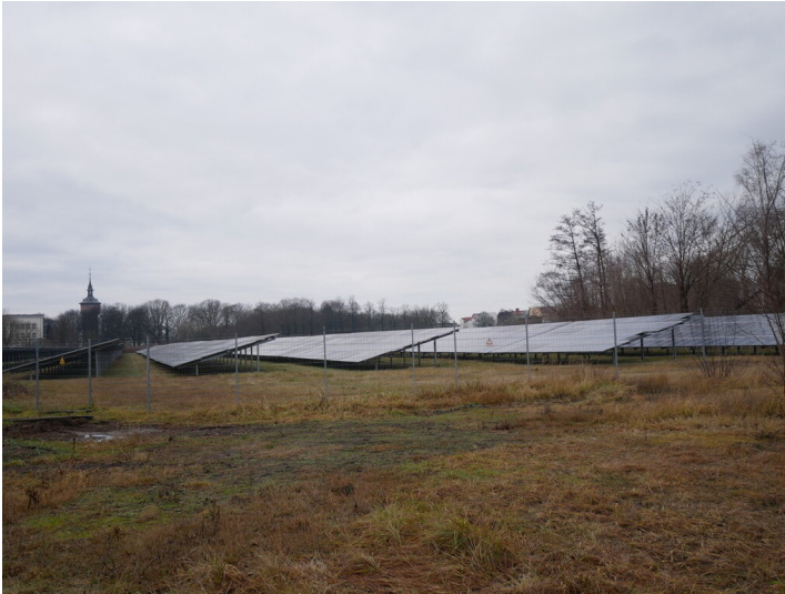
Solarfeld Elektrizitätswerk Forst