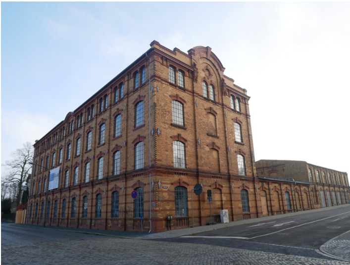
Tuchfabrik Noack

Schlagwörter: Tuchfabrik Fachsicht(en): Denkmalpflege Gemeinde(n): Forst (Lausitz) Kreis(e): Spree-Neiße Bundesland: Brandenburg