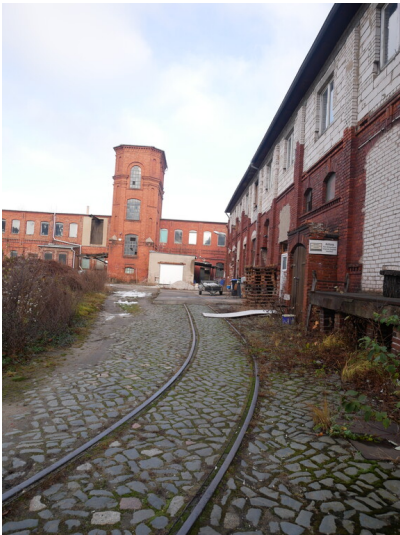
Wohnhaus mit Einfriedung, Fabrikgebäude, Hofbefestigung und Gleisfragment