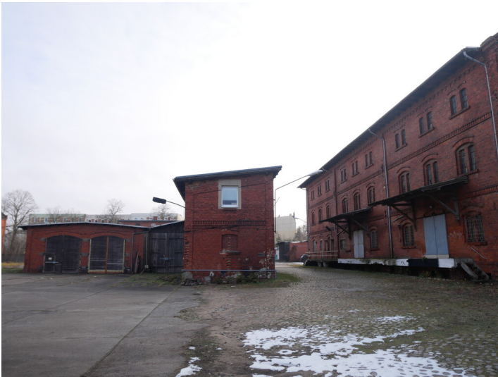
Güterbahnhof Forst