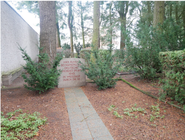
Gedenkstein umgesetzt aus Weißagk