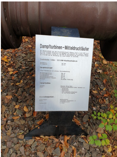
Mitteldruckläufer einer Dampfturbine