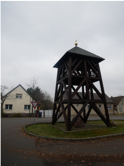
Erinnerungsstätte Groß-Lieskow