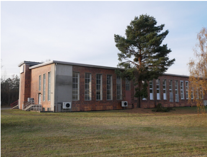
30-kV-Station Gleichrichter West