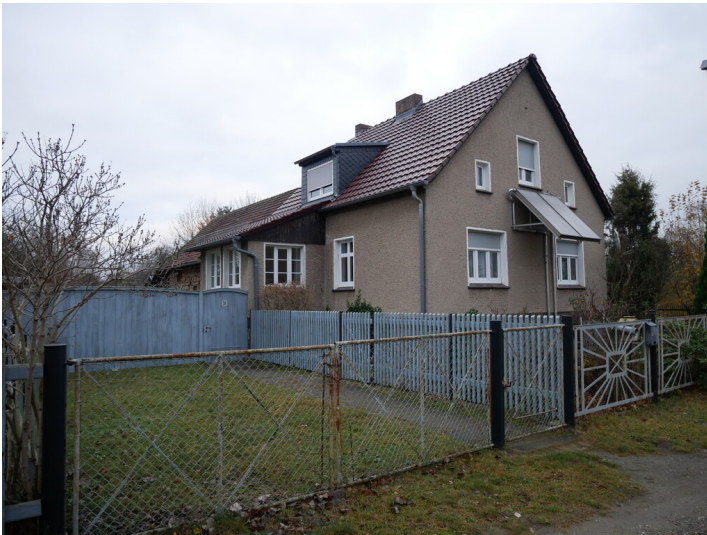
Gut Lakoma