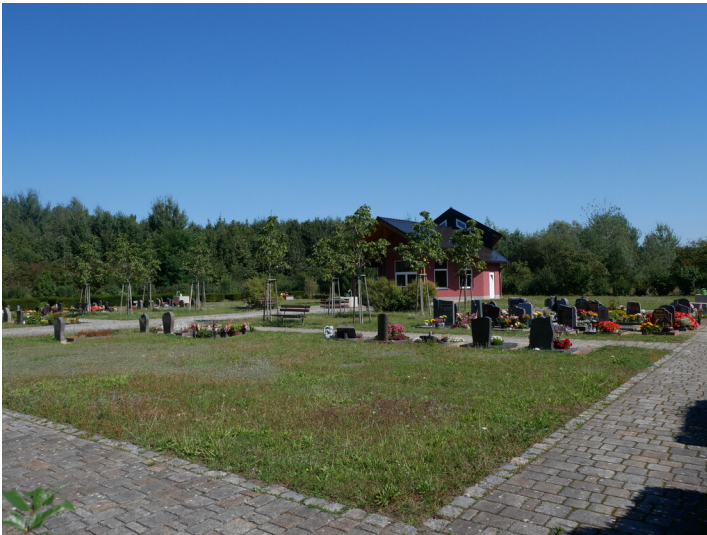
Friedhof Haidemühl