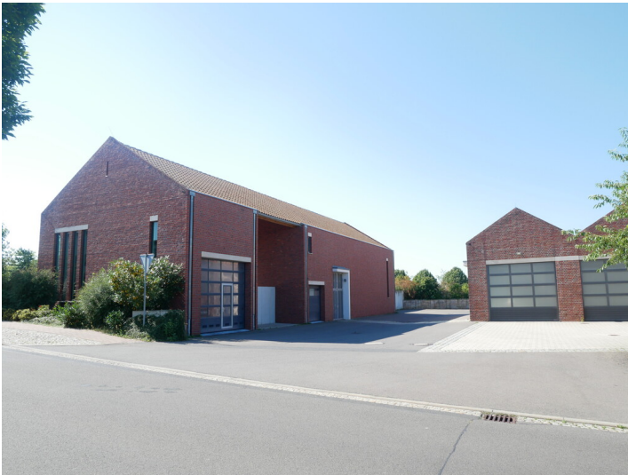
Freiwillige Feuerwehr Haidemühl