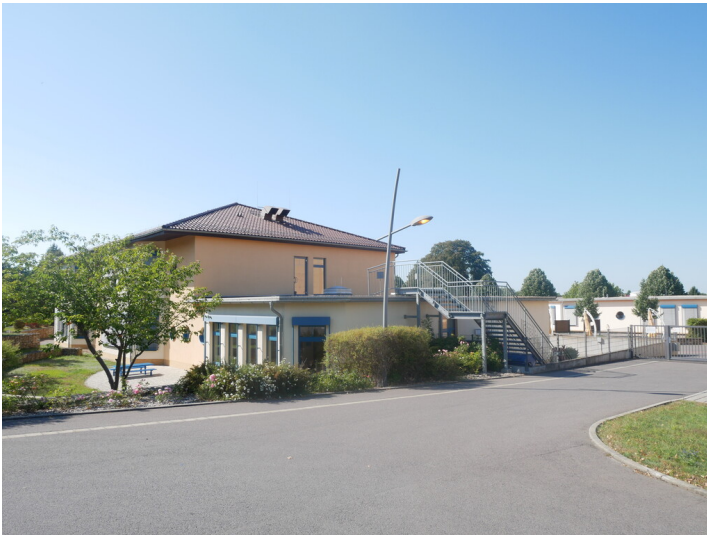
Grundschule Neu-Haidemühl