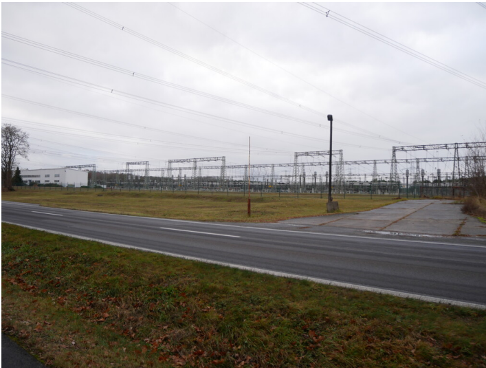
Umspannwerk Preilack