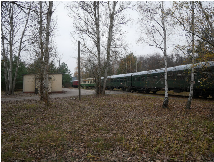
Lausitzer Dampfloklub