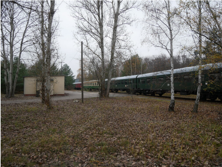
Lausitzer Dampfloklub