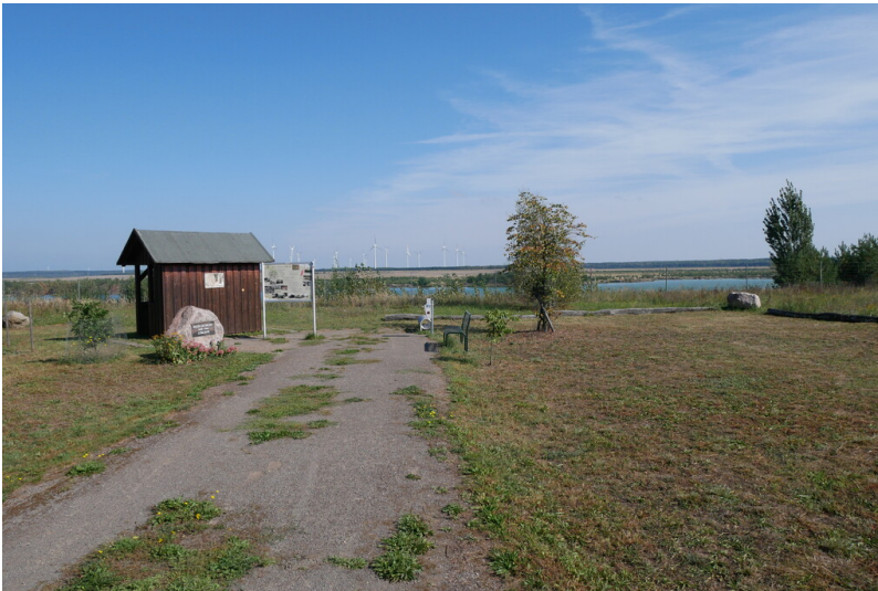
Klein Lieskow