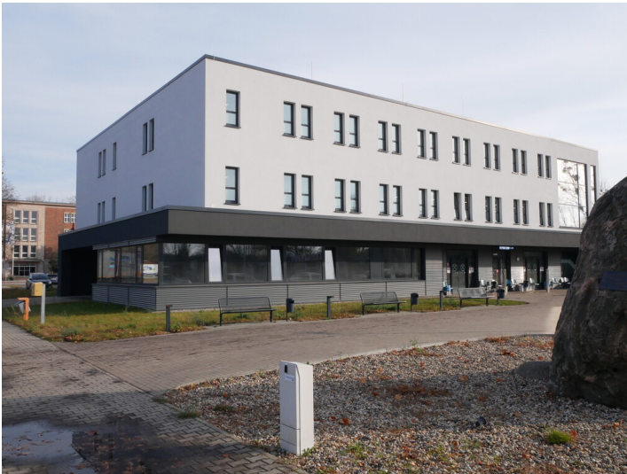
Kaue Tagebau Welzow-Süd