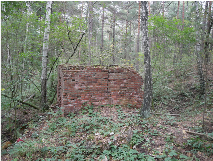
Schornstein des Kesselhauses