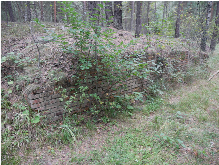
Brückenfundament Seilbahn