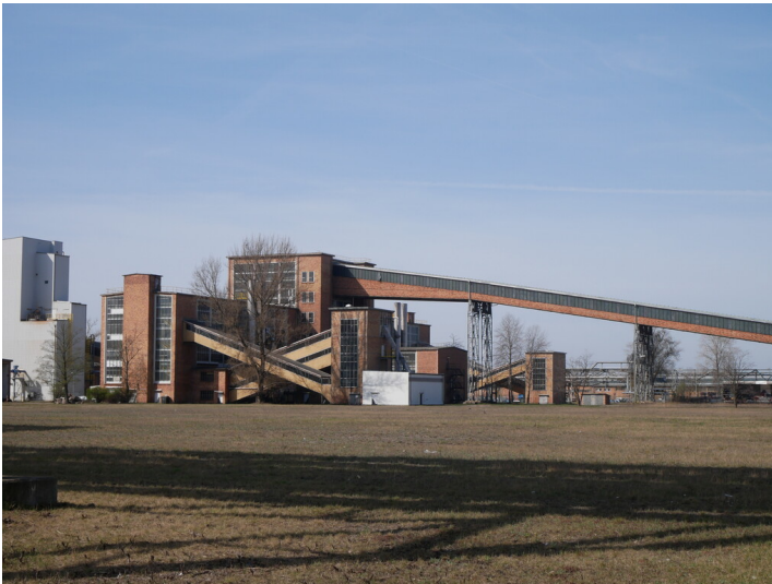
Nassdienst Fotograf/Urheber: Tanja Trittel

Schlagwörter: Brikettfabrik Fachsicht(en): Denkmalpflege Gemeinde(n): Spremberg Kreis(e): Spree-Neiße Bundesland: Brandenburg