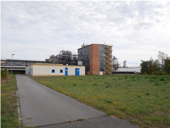
Durchlaufbunker West