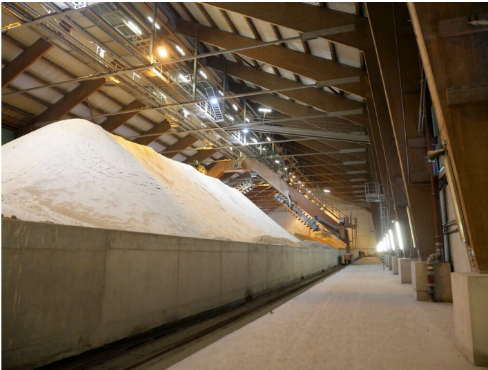
Gipslager und -förderung