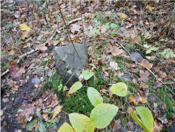
Grenzstein in der Anlage Tiefbau