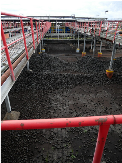
Rinnen- und Kühlschranksanlage

Schlagwörter: Brikettfabrik Fachsicht(en): Denkmalpflege Gemeinde(n): Spremberg Kreis(e): Spree-Neiße Bundesland: Brandenburg