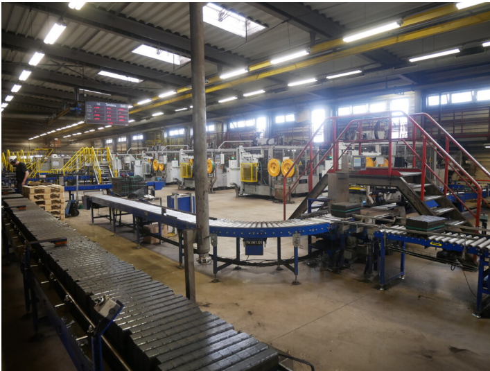
Bündel- und Palettierhalle

Schlagwörter: Brikettfabrik Fachsicht(en): Denkmalpflege Gemeinde(n): Spremberg Kreis(e): Spree-Neiße Bundesland: Brandenburg