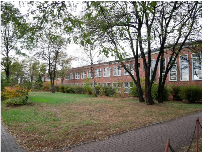
Verwaltungs- und Sozialgebäude Brikettfabrik Schwarze Pumpe