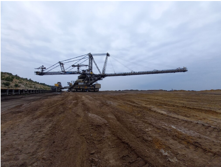
Absetzer 1105 A2Rs-B 15400.120