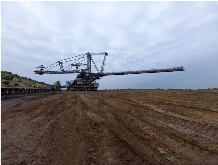
Absetzer 1105 A2Rs-B 15400.120