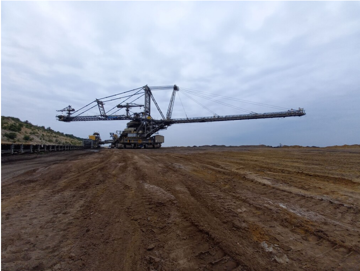
Absetzer 1105 A2Rs-B 15400.120