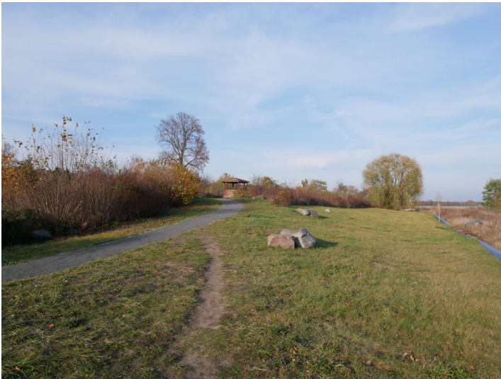
Aussichtspunkt bei Lakoma