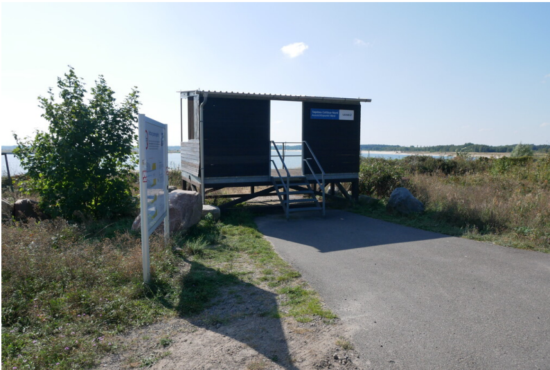
Aussichtspunkt Cottbus West