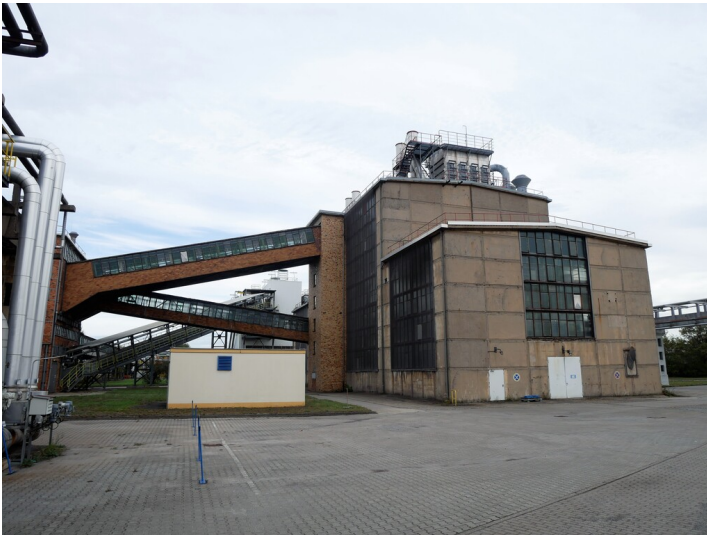
Nachbehandlung Ost