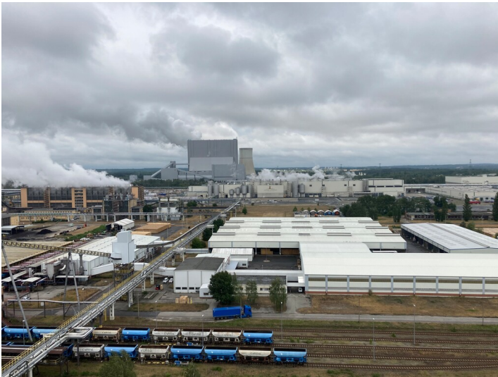
Papier- und Kartonagenfabrik