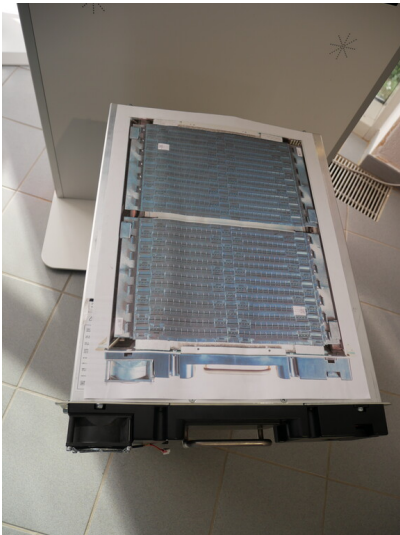
BigBattery Lausitz