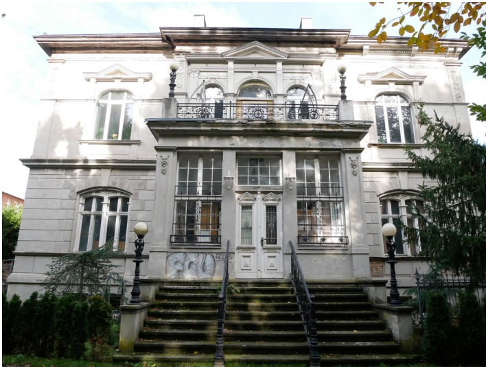
Fabrikantenvilla Ernst Elias