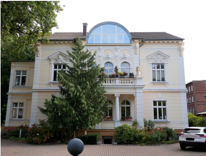
Fabrikantenvilla der Tuchfabrik Elias