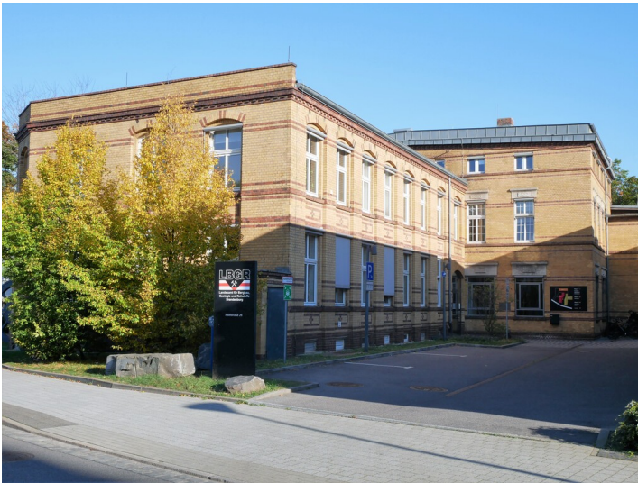
Verwaltungsgebäude des Landesamt für Bergbau, Geologie und Rohstoffe (LBGR)