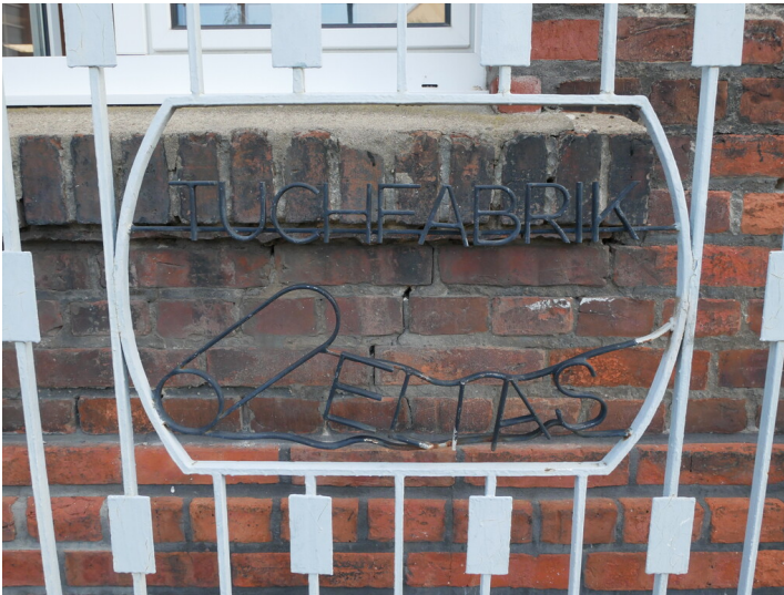
Hauptgebäude der Tuchfabrik C.S. Elias