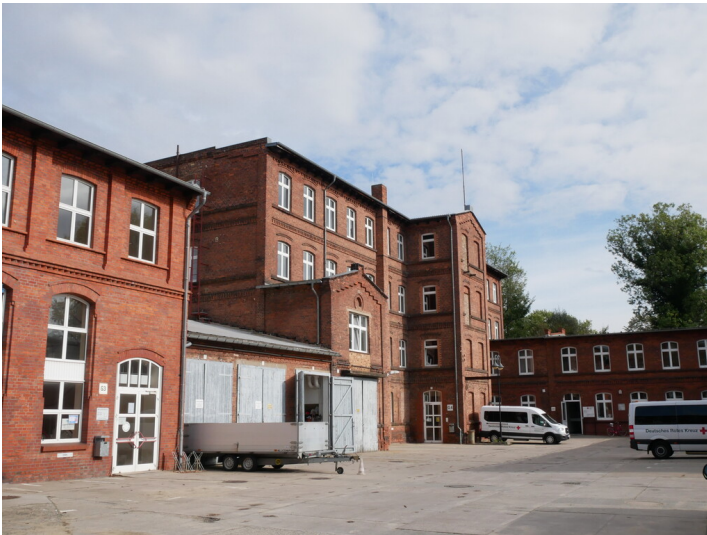
Wollwäscherei der Tuchfabrik Carl Samuel Elias