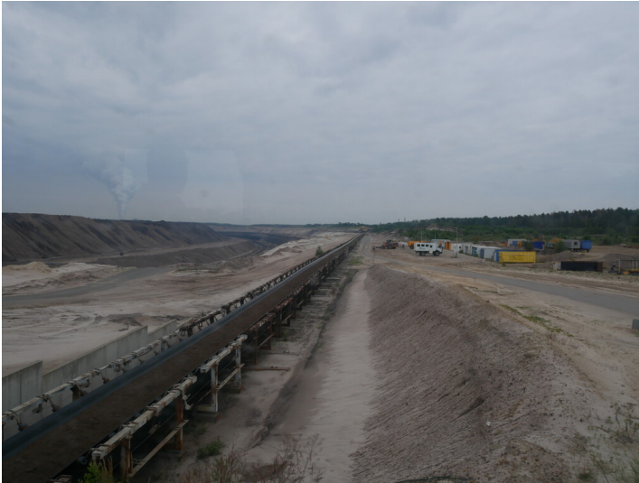
Gurtförderer zwischen Vorschnittbagger und Absetzer